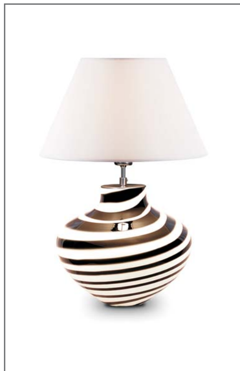
AMFORA B&W L1