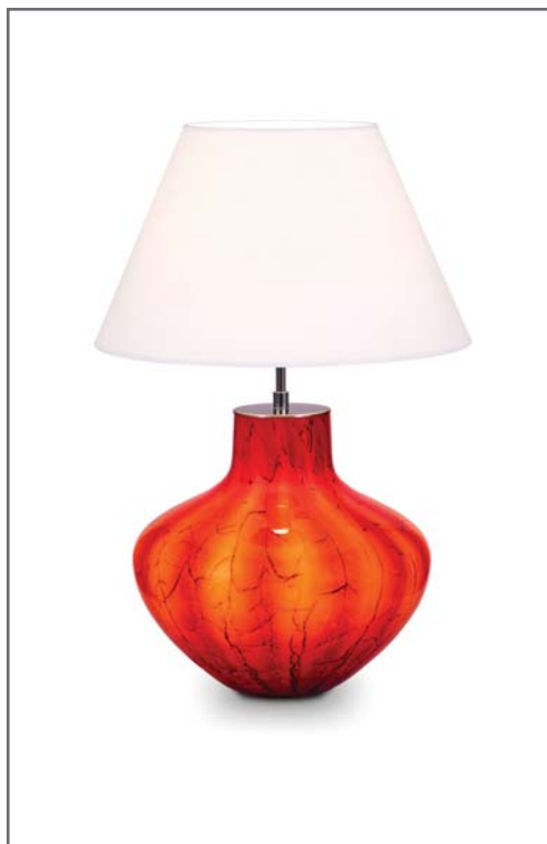
AMFORA RED L1